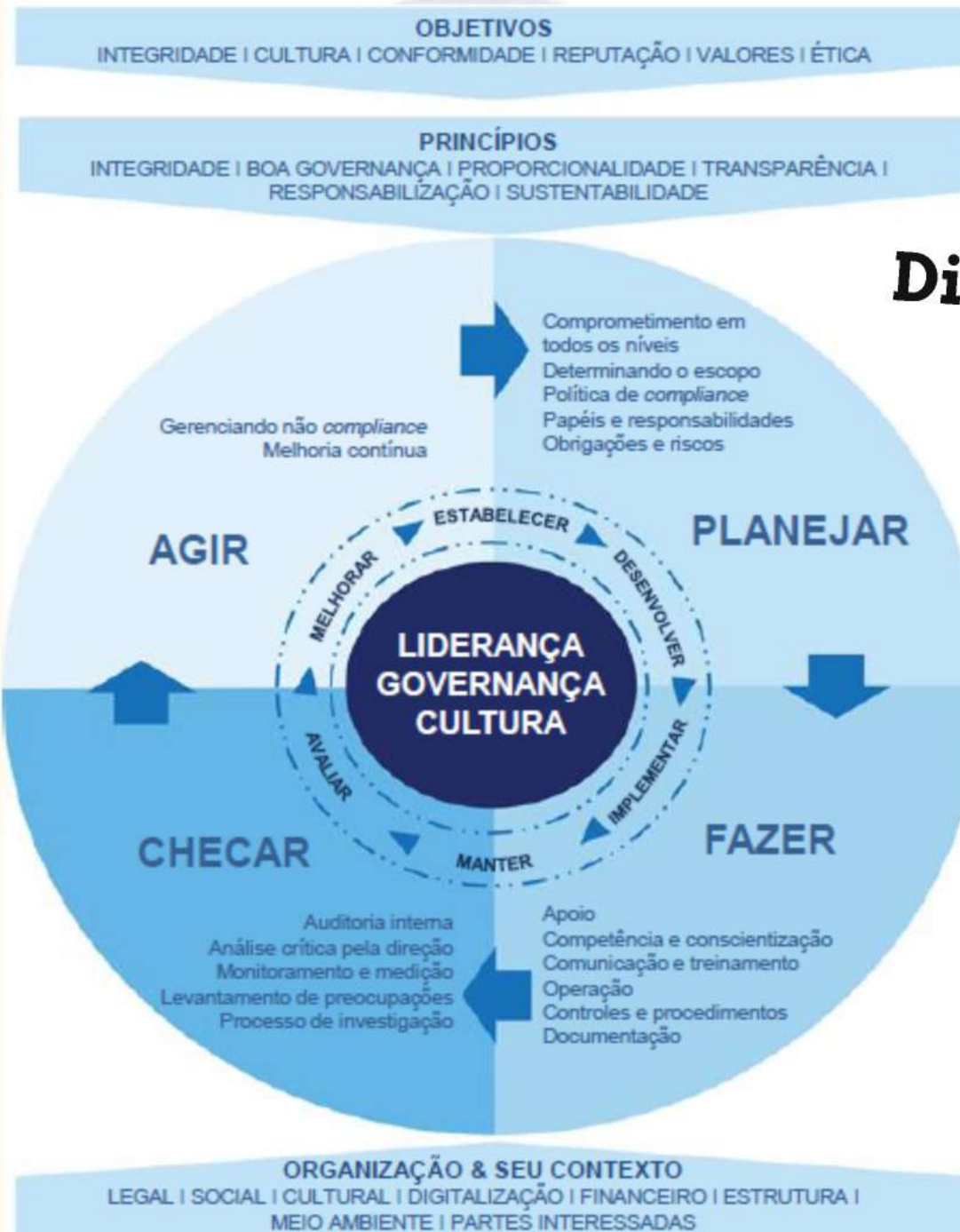
Diagrama do SGC